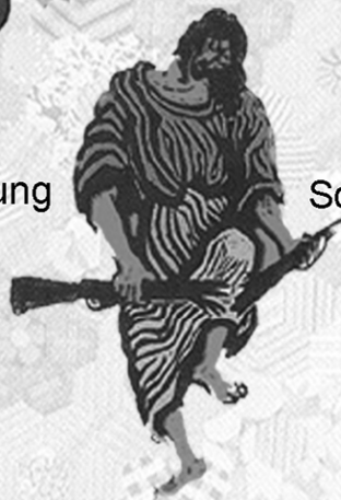
Eintreten für Frieden und Verständigung