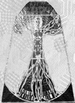
Wissenschaftliche und ästhetische Kompetenz