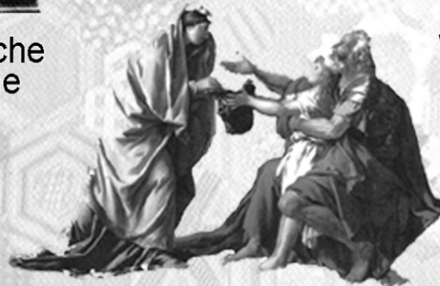
Ethische Fundierung des Handelns